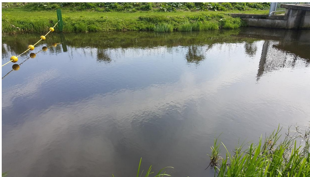
Figuur 3: Foto locatie tijdens veldbezoek op 27 juni 2019.