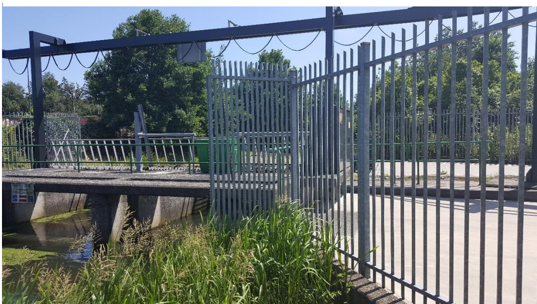
Figuur 5: Foto locatie tijdens veldbezoek op 27 juni 2019.