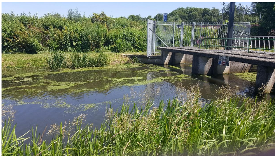
Figuur 4: Foto locatie tijdens veldbezoek op 27 juni 2019.