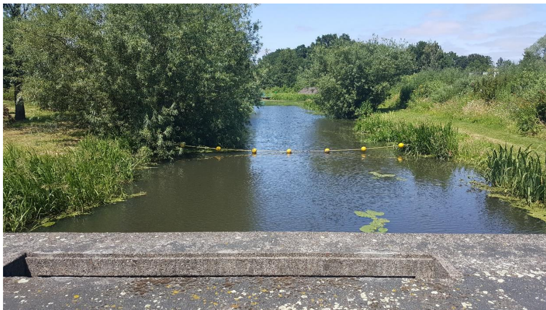
Figuur 2: Foto locatie tijdens veldbezoek op 9 april 2019.